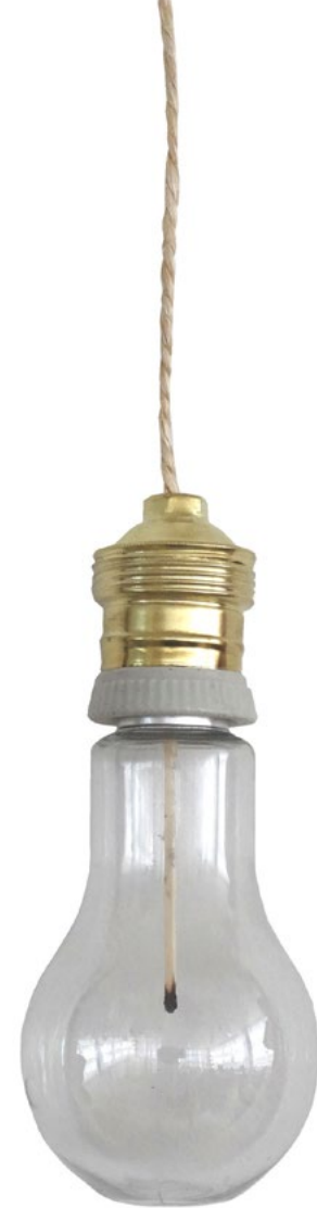
Bombilla de cristal de zafiro. 16 x 7cm. Longitud indefinida