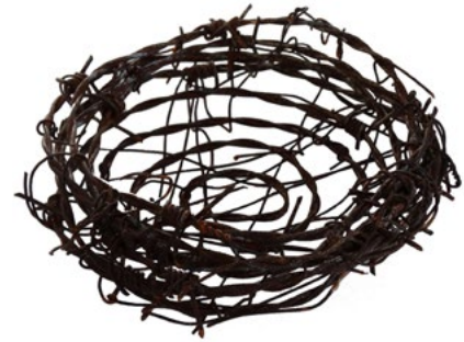
Nido. 13,5 x 12,5 x 5cm.