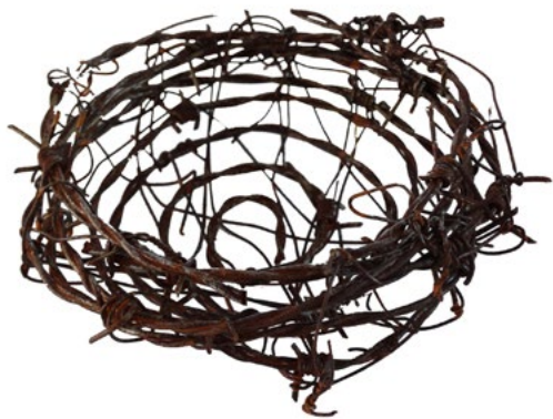
Nido. 16 x 15 x 6cm.