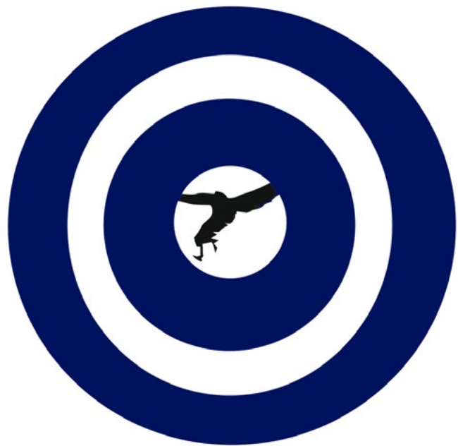
Ensayo. 65 x 50cm.