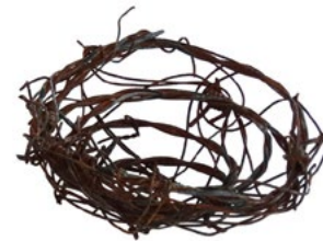
Nido. 9,5 x 9 x 4cm.