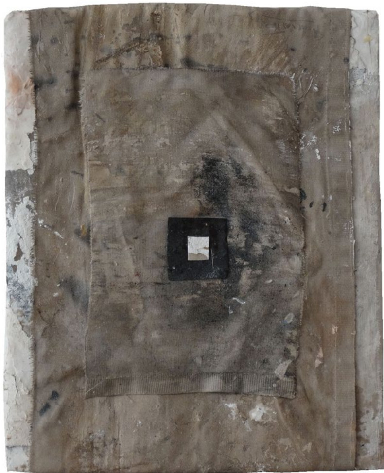
Astro. 27 x 22cm.