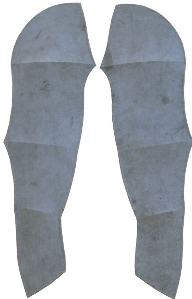
Alas de gigante. Modelo albatros. 186 x 55 x 20cm. (Ala)