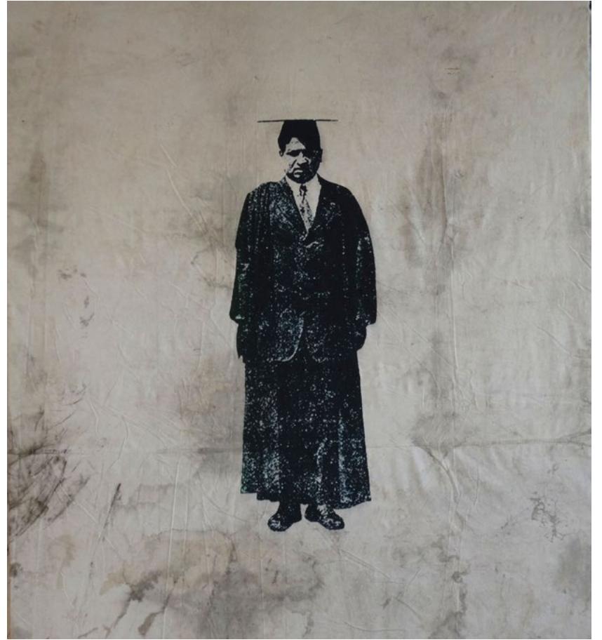
Ramanujan. 200 x 180cm.