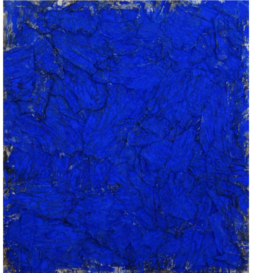
Color del cielo, sin nubes. 200 x 180cm.