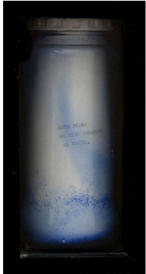
Poema envasado al vacío. 19,5 x 10,5 x 10cm.