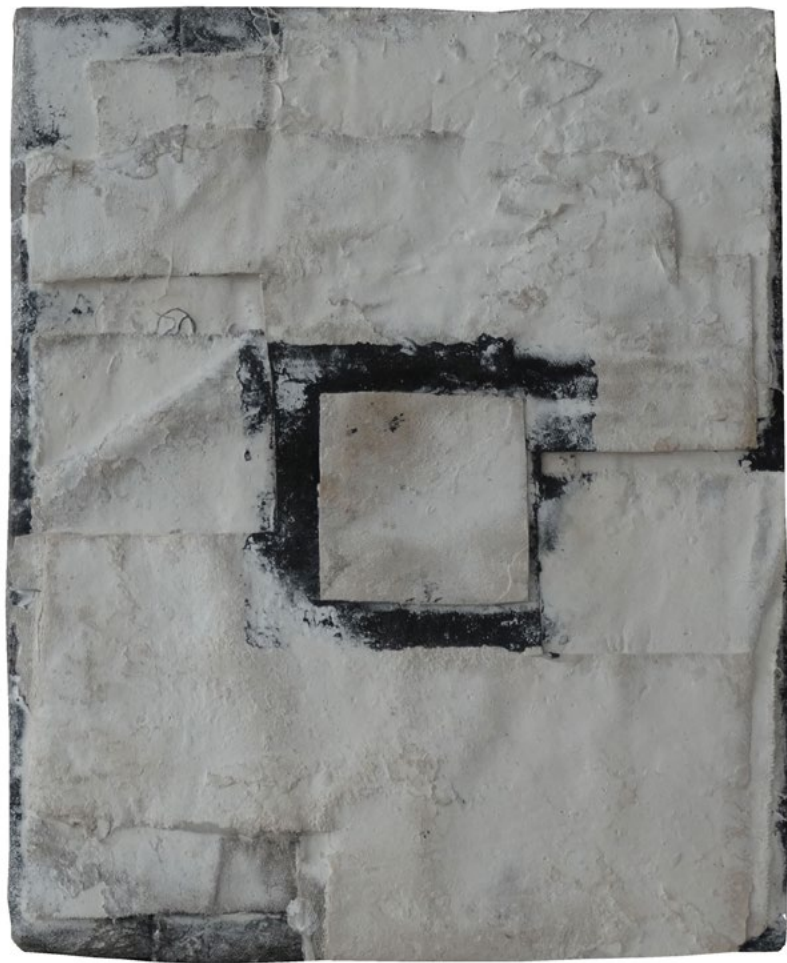
Astro. 27 x 22cm.