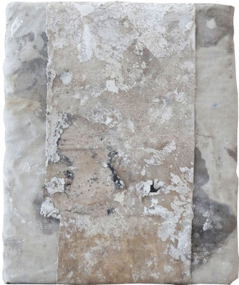
Luna. 27 x 22cm.