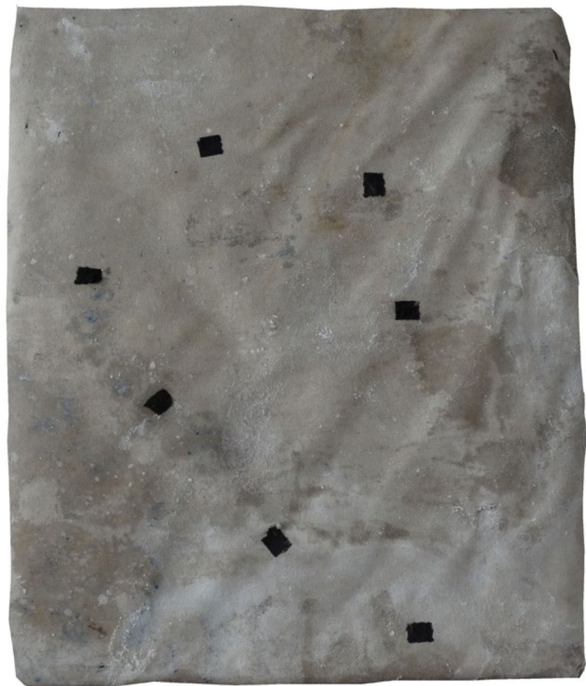
Constelación. 27 x 22cm.