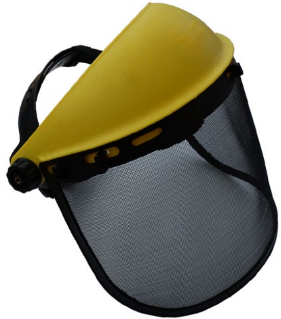
Protector de lecturas. (Objeto encontrado)