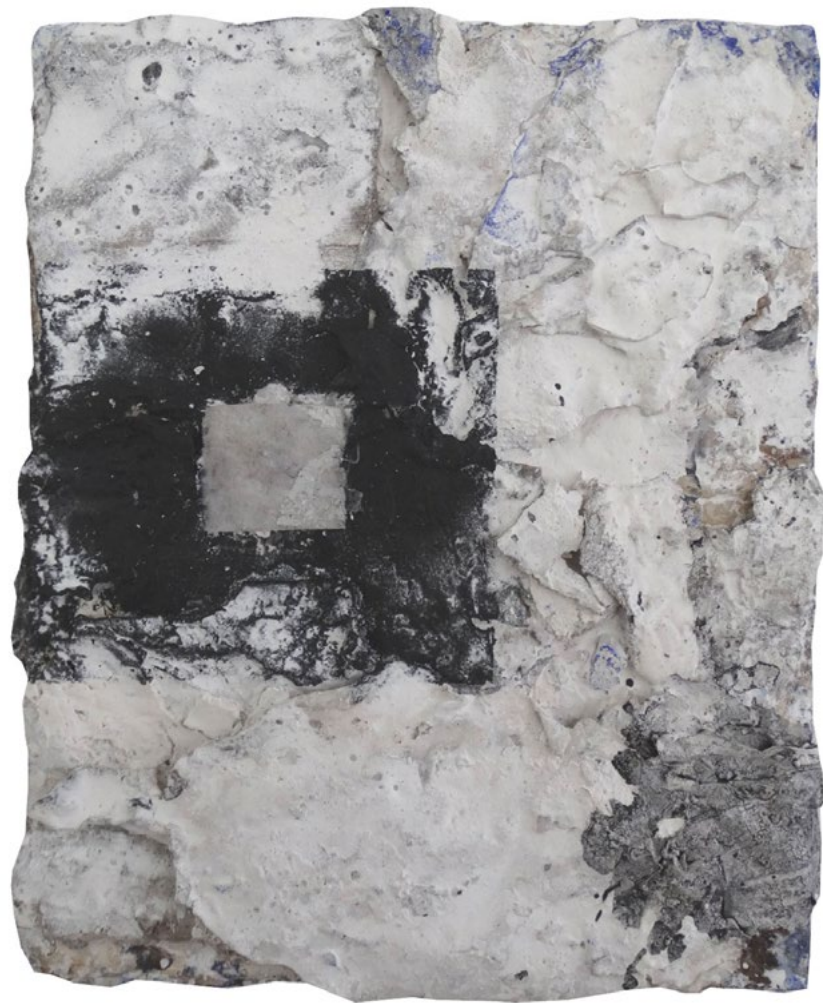
Astro. 27 x 22cm.