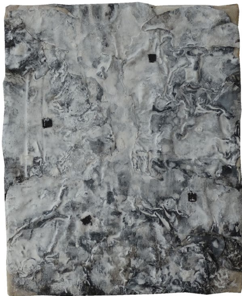
Constelación. 27 x 22cm.