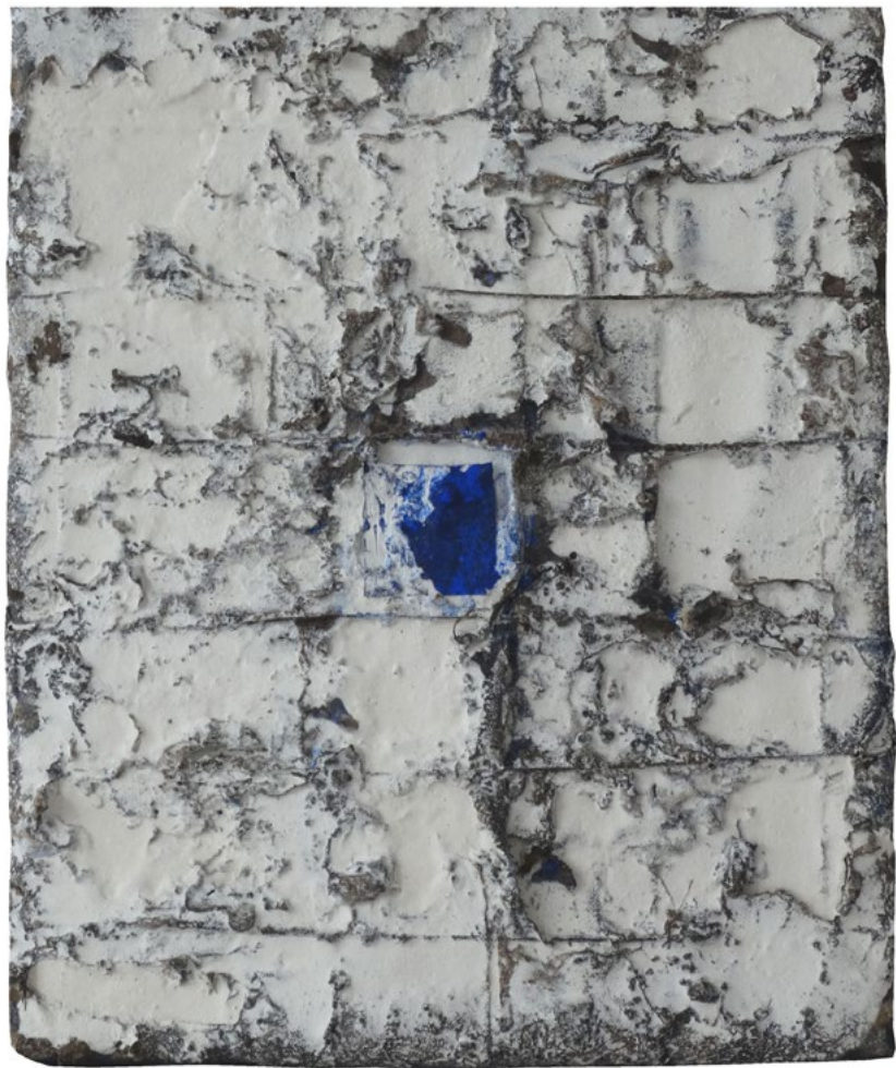
Astro. 27 x 22cm.